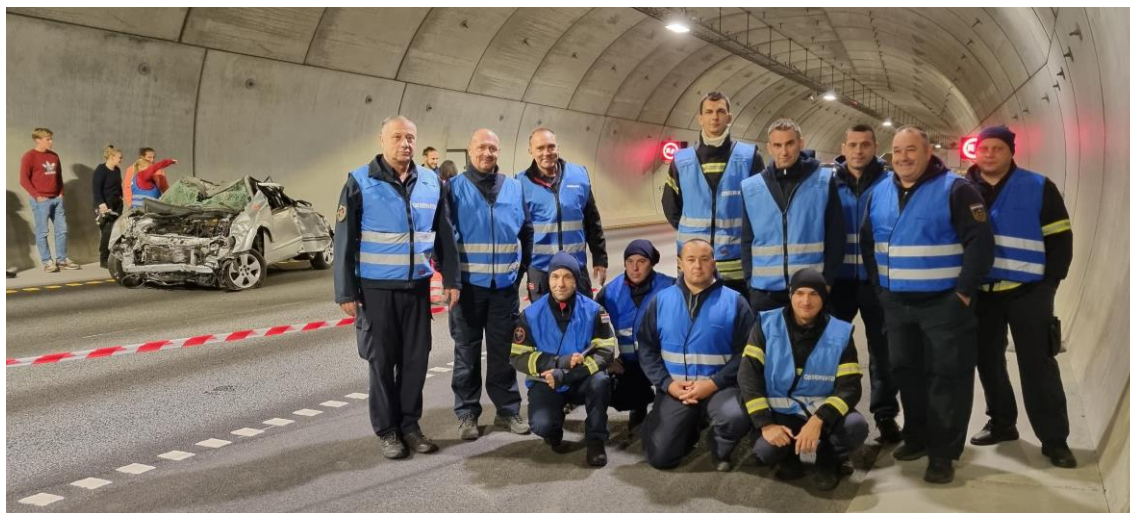
Blant observatørene var en gruppe brann- og redningspersonell fra Kroatia.

Bare få dager før øvelsen i Kongsbergtunnelen (2 km) var det en ny hendelse i Oslofjordtunnelen (7,3 km) med brann i en lastebil. Det oppstår i gjennomsnitt to branner i norske tunneler hver måned og en rekke andre hendelser. Det må derfor tas høyde for at alvorlige hendelser kan oppstå, og da er det viktig å ha godt drillede nødretter til å ta hånd om situasjonene. På E 134 har det kommet flere nye tunneler i vår region de siste årene. I tillegg til de tre i Kongsberg har spesielt den 9,4 km lange Mælefjelltunnelen i Telemark hatt stor betydning for reisetid og sikkerhet på den høyt trafikkerte hovedstrekningen mellom øst og vest.