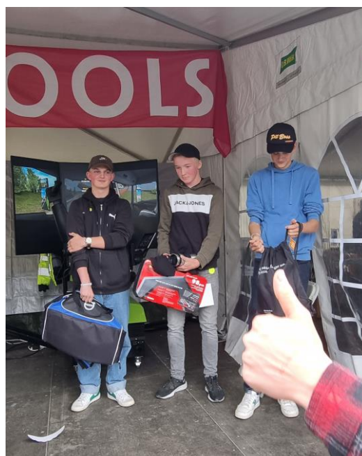
De tre beste i simulatorkonkurransen mottar premier