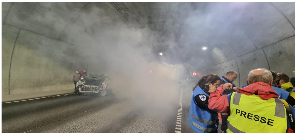
Brann i den andre bilen