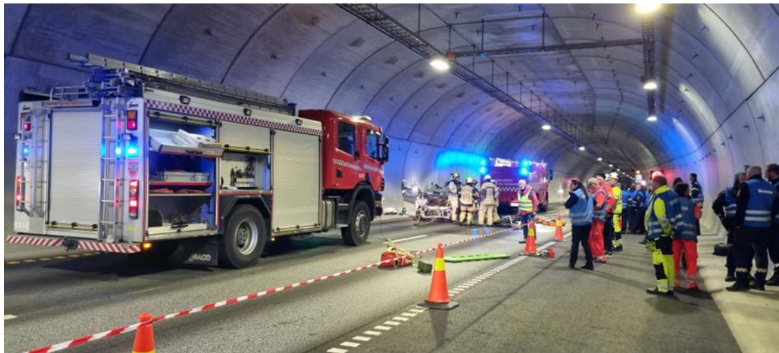
Hektisk aktivitet under beredskapsøvelsen i Kongsbergtunnelen.

Statens vegvesen og nødetatene har holdt øvelse for å bli bedre rustet til å håndtere hendelser i Kongsbergtunnelen.