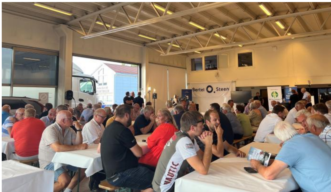
Over 100 personer kom på NLFs medlemsmøte på onsdag.