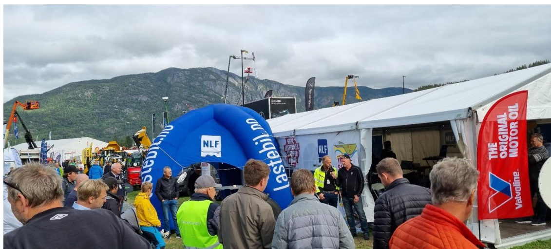
Liv og røre i og rundt NLF teltet på Dyrskuplassen

Fra 1866 har Dyrsku'n i Seljord kun vært avlyst de to årene pandemien satte en stopper for det. For NLF har det også blitt en tradisjon å delta med informasjonsstand. NLF-teltet var i år igjen en fin møteplass for medlemmer og andre lastebil- og transportnæringsinteresserte. Blant annet fikk de mulighet til å snakke ansikt til ansikt med representanter fra NLF sentralt og fylkesavdelingene i region 3.