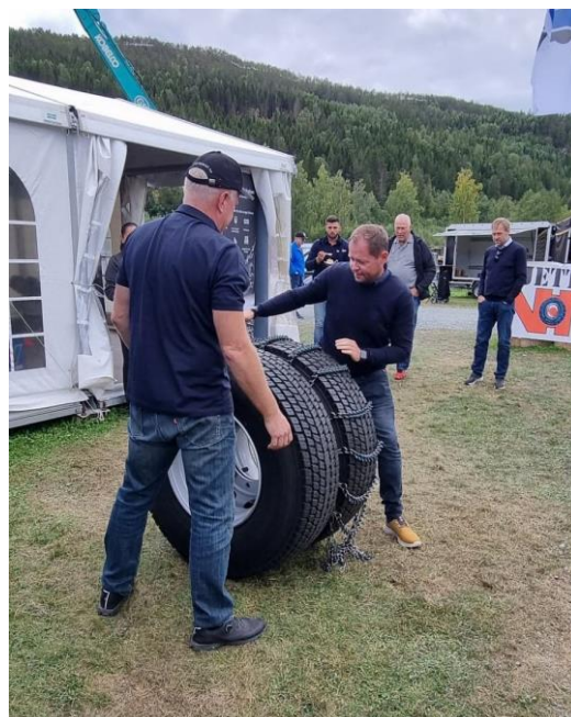
Fylkeslederne i uhøytidelig regionmesterskap