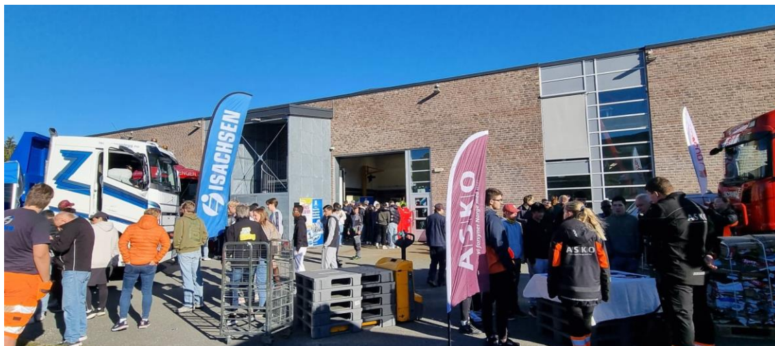
Elever og bedrifter utenfor Åssiden videregående skole

Åssiden videregående skole var første stopp i region 3 for årets turne. Sammen med NLF og OLT var fire bedrifter med behov for mange nye yrkessjåførere i årene fremover. På turneen informeres det om veiene inn i yrket og det gis mulighet for å ha direkte samtaler med bedriftene. I tillegg er det aktiviteter som kjøresimulator og kjettingkonkurranse.