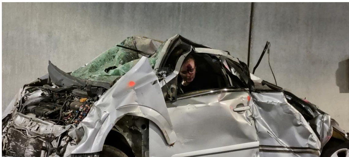
Den ene rammede bilen hadde fått hard medfart og to personer var innestengt i den.

Det som møtte dem på ulykkessteder var at en bil hadde krasjet i tunnelveggen, og blitt truffet av en annen bil bakfra. I den ene bilen var situasjonen at en var innesperret og en fastklemt. I den andre bilen kommer føreren seg ut, men kjøretøyet begynner å brenne og det oppstår betydelig røykutvikling i tunnelen. Brannvesen, politi og helsepersonell kommer raskt til stedet, og situasjonen blir håndtert raskt og profesjonelt.