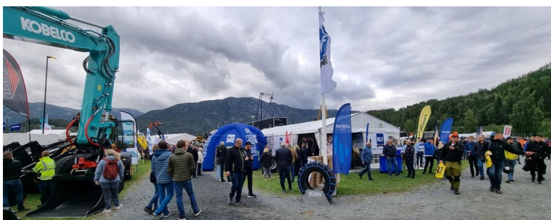
NLF flagget vaiet over Dyrskuplassen